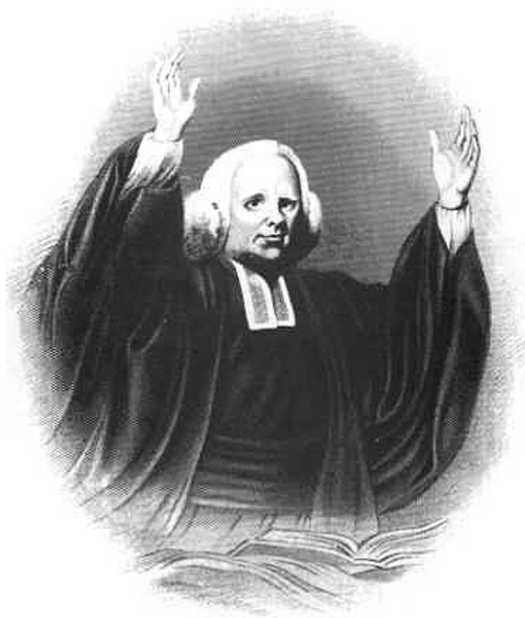
REVº GEORGE WHITEFIELD

Ainda que não possuindo o poder dramático de Whitefield, John Wesley era um pregador por poucos igualado quanto ao efeito sobre o povo - sincero, prático, corajoso. Daí em diante percorreria a Inglaterra, a Escócia e a Irlanda.