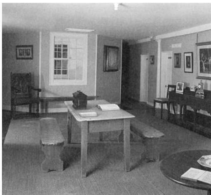
Sala Comum dos Pregadores Capela de John Wesley (New Room) em Bristol

Em volta do pátio havia estábulos para os cavalos dos pregadores. A estátua equestre de John Wesley (já mostrada) encontra-se agora no seu centro. Entrar neste pátio, vindo do moderno e movimentado centro comercial é como retroceder dois séculos e meio. Poucos visitantes Metodistas não se comoverão, ao ver a mais velha igreja Metodista do mundo.